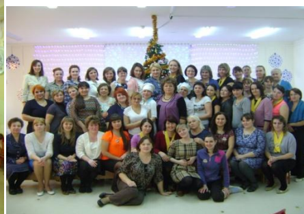
Рис.11. Пед. Коллектив 3 корпуса

Кадровый состав, обеспечивающий реализацию основной образовательной программы дошкольного образования. (Таблица 14.)