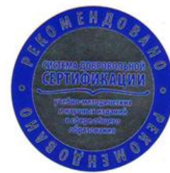
Рис. 2. Сертификация

В своей повседневной деятельности и в рамках работы инновационной площадки учреждение тесно сотрудничает с Томским государственным педагогическим университетом (ТГПУ), Томским государственным педагогическим колледжем (ТГПК), Региональным центром развития образования (РЦРО), Городским информационно-методическим центром (ИМЦ), Томским областным институтом повышения квалификации работников образования (ТОИПКРО), Музыкальной школой №5, МАОУ ДО ДОО(П)Ц «Юниор», МАОУ Лицей №1 имени А.С. Пушкина, МАДОУ №33 г. Томска, МАДОУ №50 г. Томска, МБДОУ №62 г. Томска, МАДОУ №63 г. Томска, МБДОУ №89 г. Томска, МБДОУ «Детский сад №69» г. Бийска, МАДОУ д/с №78 «Гномик» г. Белгорода, МБДОУ г. Иркутска детский сад №82.