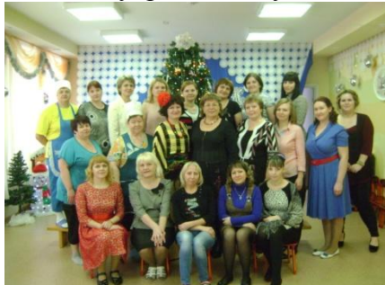
Рис.10. Пед.коллектив 2 корпуса