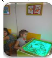
Рис.4. Песочная терапия

Работа с детьми ОВЗ требует качественной работы, поэтому формы и методы работы подбираются исключительно для каждого ребенка с учетом его ближайшей и актуальной зон развития. Так, для детей с ограничениями по речи активно использовалось конструирование, экспериментирование, метод арт-терапии, песочная терапия. А для детей с ограничением по слуху были применены наглядные и вербальные приемы, через демонстрации слайдов и через донесение нужной информации путем перефразирования.