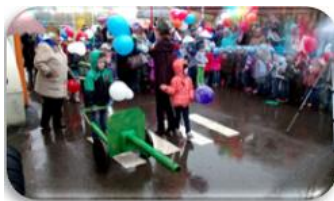
Рис. 6. Парад Победы

Особый отклик получили нетрадиционные формы работы с семьей : флэш-моб по ПДД (июль), Всероссийский флэш-моб «Должны смеяться дети» (1 июня), парад победы (май), соревнования (октябрь, февраль, апрель, июнь), конкурсы групп (в течение года), телевидение (сюжеты о жизни детского сада глазами детей - постоянно), мастер-класс в соответствии с ФГОС ДО