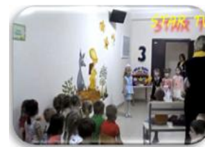
Рис.5. Открытие детского телевидения

Для того, чтобы лучше узнать каждую семью, уклад ее жизни, систему воспитания ребенка, чтобы установить необходимые взаимопонимание и доверие, работники дошкольных учреждений используют разнообразные формы индивидуальной работы с родителями: беседы, консультации, посещение семьи, приглашение отдельных матерей, отцов в детский сад, индивидуальные памятки и папки-передвижки.