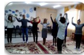
Рис. 7. Мастер-класс

Особый отклик получили нетрадиционные формы работы с семьей : флэш-моб по ПДД (июль), Всероссийский флэш-моб «Должны смеяться дети» (1 июня), парад победы (май), соревнования (октябрь, февраль, апрель, июнь), конкурсы групп (в течение года), телевидение (сюжеты о жизни детского сада глазами детей - постоянно), мастер-класс в соответствии с ФГОС ДО