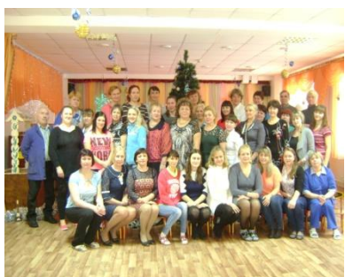
Рис.9. Пед.коллектив 1 корпуса

В ДОУ в соответствии со штатным расписанием работают 195 сотрудников. Педагогическими кадрами дошкольное учреждение укомплектовано на 100%.